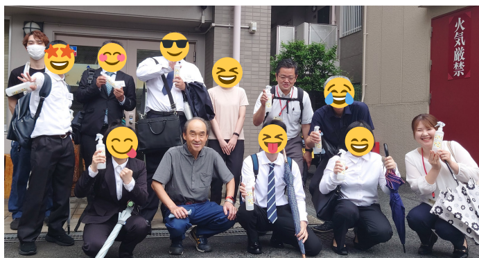
お土産に頂いたBNジョッキノールを持って記念撮影!!