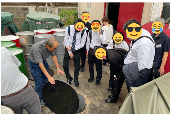
工場の外には、巨大な地下タンクが2台も設置されています。一同・興味津々です(笑)